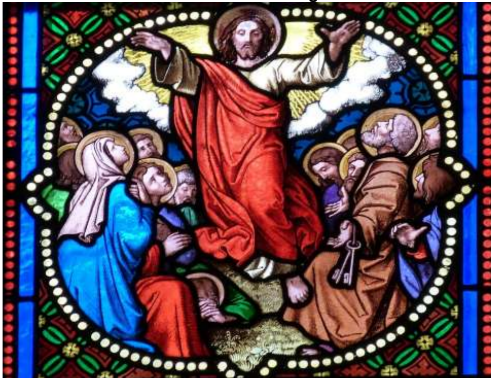
Jésus retourne vers son Père, sans nous laisser orphelins.