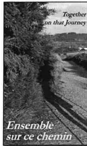
Année spéciale dédiée à saint Joseph Pèlerinage - Diocèse de Valleyfield

11 août : Fête de sainte Claire, fondatrice des Clarisses. Portons dans notre soutien et notre prière les religieuses de cette communauté si importantes dans notre diocèse.